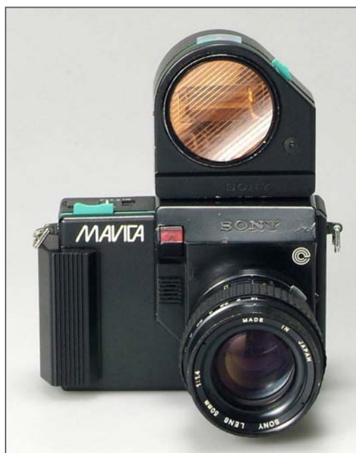
1981 - Sony Mavica

L'arrivée de l'appareil photo « vidéo » Mavica, qui restera à l'état de prototype, fut un véritable choc (connu sous le nom de 'Mavica choc'). C'est à cette occasion que tous les fabricants d'appareils photos, d'équipements électroniques et de films ont accentué leurs efforts de recherche et de développement des technologies numériques. Cependant, la qualité de la résolution n'était pas suffisamment bonne à cause de la technologie d'enregistrement analogique de l'époque et ces premiers appareils photo « vidéo » n'ont pas connu un grand succès commercial.